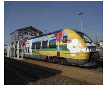
Passerelle d'accès à la toiture.

La conformité aux exigences du code du travail est une autre spécificité d'AT Industrie, qui profite de ses connaissances en matière de réglementation. "Nos matériels font souvent l'objet d'un contrôle par les