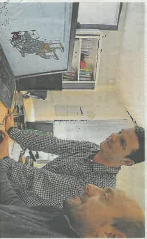
Le bureau d'études d'ATI Industrie a récemment mis au point une passerelle modulaire adaptée à l'entreprenariat de trois modèles d'avions chez Boeing.

finallement gérer l'atelier et une trentaine de personnes. Malgré la fermeture de l'entreprise, je savais que les compétences dans l'accès technique en hauteur étaient indéniables. La bonne santé d'ATI en est la preuve », se félicite le parthenaisien pur souche soucieux de valoriser le savoir-faire local. « Car il est bien réel et on doit en être fier. Il fallait juste optimiser notre outil de production, gagner en productivité par la concentration, la réflexion et l'organisation. » Sans doute la plus ingénieuse des passerelles conçue par ATI.